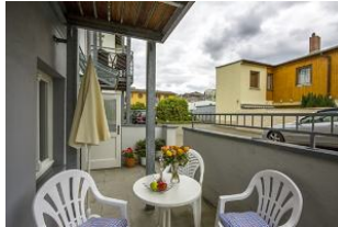
Eigene kleine Terrasse