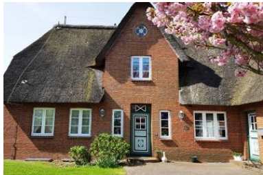
Haus Faltings in ruhiger Lage im Ortsteil Goting mit 3 Wohneinheiten