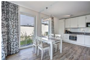
Essplatz und Küche