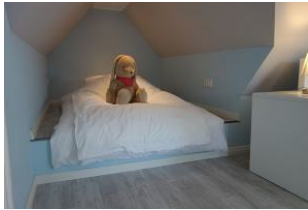
...die wir auf Wunsch auch zum Bett umfunktionieren können.