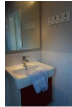
Auch im Dachgeschoß befindet sich ein kleines Bad mit Waschtisch, Toilette (nicht im Bild) und...