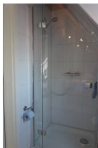
...Duschkabine mit Echtglas.