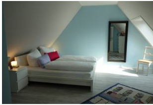
...großes Doppelbett 180x200cm ohne Fussende