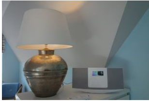
...und eine Musikanlage.