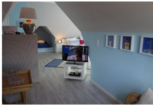
...wer mag, kann den TV-Tisch auch zum Bett drehen !