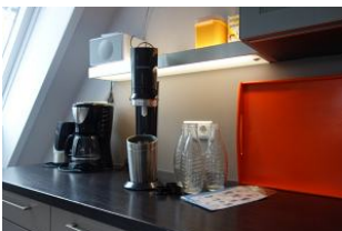
....kein-Flaschen-schleppen mehr ! Ein Soda Stream mit Echtglas-Flaschen.....