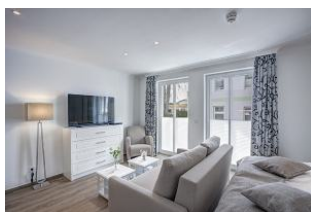
Flachbild TV und Couch