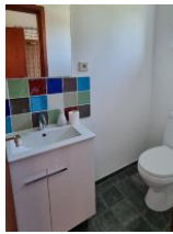
Gäste WC EG