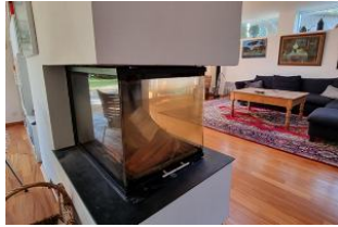
Kamin im Wohn und Essbereich