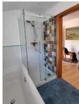
1 Bad mit Badewanne und Dusche