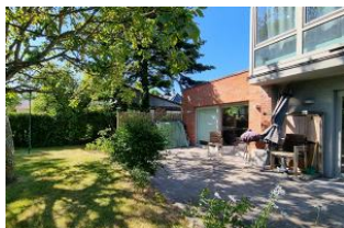
Terrasse und Garten