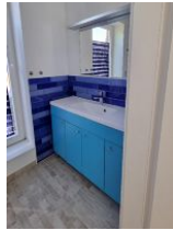
2 Bad mit Dusche