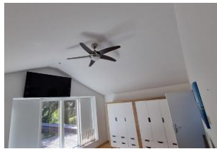
Schlafzimmer mit Dachterasse