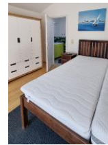
Schlafzimmer mit extra Bad