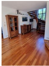
Aufgang zu den Schlafzimmern