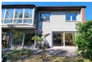
Ansicht vom Garten