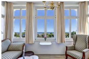
Veranda mit Seeblick