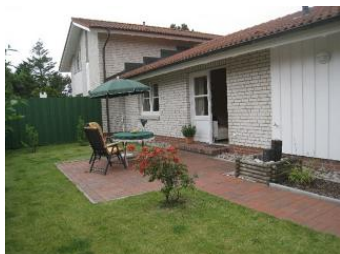
Haus Anna, Eingang + Terrasse mit.....