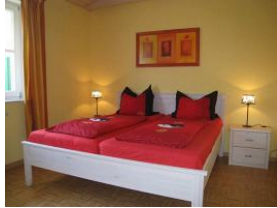
Das Schlafzimmer mit Doppelbett 180x200cm Nicht im Bild: Kleiderschrank + TV Gerät.

Die Terrasse ist gleichzeitig der Eingang zur Wohnung