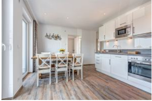
Essplatz und Küche