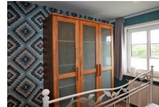
Der Kleiderschrank im Schlafzimmer