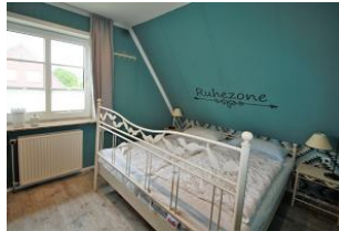
Für erholsamen Schlaf sorgt das liebevoll eingerichtete Schlafzimmer.