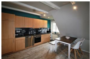
Die vollausgestattete Küche

Das Haus Nis Puk ist nur ca. 800m vom Dorfkern Utersum entfernt, so dass Sie fußläufig alles erreichen können, was Sie für den täglichen Bedarf benötigen. Der Strand ist nur wenige Gehminuten entfernt, hier kann man die phänomenalsten Sonnenuntergänge der gesamten Insel erleben. Die im Obergeschoss befindliche Wohnung ist mit ihren 60 qm 2 , dem eigenen Parkplatz und den zwei gemütlichen Schlafräumen, dem Wohnraum mit WLAN-Zugang, einer vollausgestatteten Kochnische und dem Duschbad ideal für 4/5 Personen geeignet und lädt mit der stilvollen Einrichtung, die liebevoll ausgewählt wurde, sowie einer Sitzecke im Garten zum Wohlfühlen & Relaxen ein.