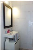
Handwaschbecken und großer Spiegel, gute Beleuchtung