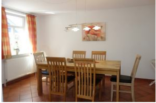
Das Esszimmer - Platz für Alle