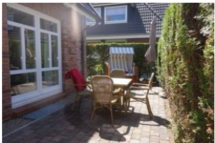
Der herrliche Terrassenplatz

Entfernungen, zirka: zum Bäcker 150 m, zur Einkaufsmöglichkeit 150 m, zum Flugplatz 3,0 km, zum Golfplatz 3,0 km, zum Hafen 2,0 km, zum Meer 200 m, zum ÖPNV 70 m, zum Badestrand 200 m, zum Ortszentrum 120 m