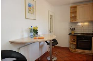
...mit kleinem Essplatz