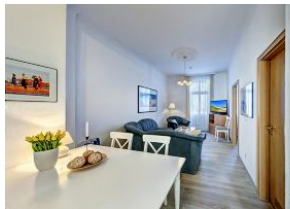
Wohnraum mit direktem Zugang zum Garten und dortiger Terrasse