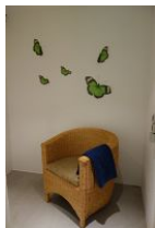
...und gemütlichem Sessel zum ausruhen.