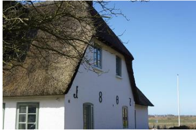
Die Unterkunft befindet sich im 1.OG.

Die nordfriesische Insel Föhr ist bekannt für ihre idyllischen Friesendörfer und ihre malerische Marschlandschaft. Eines dieser charmanten Dörfer ist Midlum, wo sich unser Ferienhaus aus dem Jahr 1807 befindet. Das Haus grenzt direkt an Wiesen und Felder und besticht mit seinem typischen Reetdach und dem authentischen friesischen Charme. Von hier aus genießt du einen atemberaubenden Blick bis hin zum Deich, der kilometerweit entfernt liegt. Ein Aufenthalt in diesem Ferienhaus bietet somit nicht nur Erholung und Entspannung, sondern auch die Möglichkeit, die Schönheit der Föhrer Landschaft hautnah zu erleben. Das gesamte Haus bietet ausreichend Raum und Privatsphäre für zwei Familien, Freunde oder mehrere Generationen. Es gibt zwei Ferienwohnungen, die sich auf Erd- und Obergeschoss verteilen. Die Wohnungen sind komplett autark voneinander nutz- und buchbar. Gleichzeitig lassen sich die Wohnungen und Gärten wunderbar miteinander kombinieren. Das über 1000 m 2 große Grundstück ist dank seiner Gartenlandschaft mit Hecken und Zäunen zur Nachbarschaft gut abgegrenzt. Der Garten teilt sich jeweils für die Wohnungen auf. Sitzcken und Strandkörbe laden zu Ruhe und Entspannung an sonnigen Nachmittagen ein.