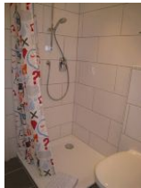
....und flacher Duschwanne.