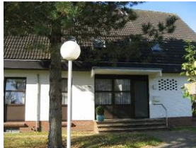
Die Haustür des Hauses Gmelinstr. 28 Haus 5