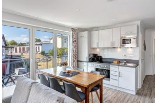
Küche und Essplatz