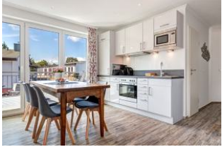
Küche und Essplatz