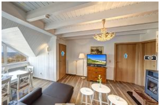
Wohnraum mit Seeblick

Direkt an der Strandpromenade mit phantastischem SEEBLICK und großem SÜDBALKON - das Besondere! Die außergewöhnliche 4-Zimmer-Wohnung mit zusätzlicher Empore nimmt das gesamte 2. Ober- und Dachgeschoss ein (ca. 96 qm). Drei separate Schlafzimmer (2 davon ohne volle Raumhöhe, gut geeignet für Kinder, Bad mit 2- Pers.-Whirlpool-Wanne und großer Dusche, zus. Gäste-WC, Küche, großes Wohnzimmer mit Kaminofen und verglaster Loggia mit Eßplatz und Seeblick sowie ein großer Balkon nach Süden mit Sonne bis abends machen die Wohnung zum Highlight! Das Mobiliar im Wohnzimmer ist teilweise antik, die Wohnung dennoch insgesamt modern und hell. Die Wohnung verfügt über einen Pkw-Stellplatz. Ein Strandkorb am Strand ist incl., eine Garage für Fahrräder und ähnliches (für das gesamte Haus) vorhanden. Im Haus gibt es eine Sauna. es sind vom Haus 50 m zum Strand, ca. 3 Min. zu Fuß ins Zentrum! (Tourismusverb.)