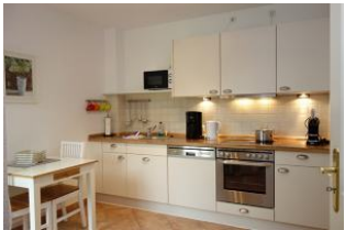
Ein zweiter Essplatz in der Küche und ein Teil der Küchenzeile.