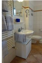
Das Bad mit Handwaschbecken, Handtuchheizung, Toilette....