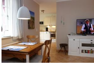
Der Durchgang zur Küche...