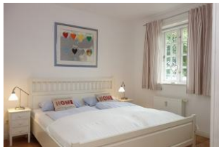
Das Elternschlafzimmer mit Doppelbett 180x200cm