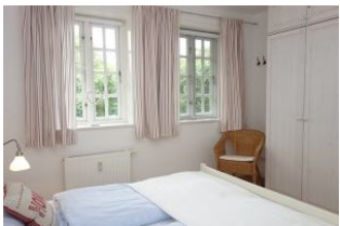
Der große Kleiderschrank hat viel Platz für die Kofferinhalte