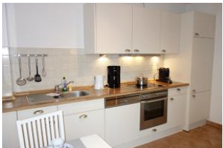
...der andere Teil der Küche.