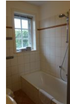
...Badewanne mit Duschmöglichkeit.. Nicht im Bild: der Wäschetrockner - kostenfrei zu nutzen