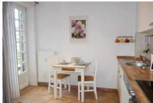
...der Essplatz, links der Austritt auf die Terrasse