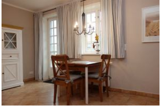
Der Esstisch aus der Nähe, ausziehbar.