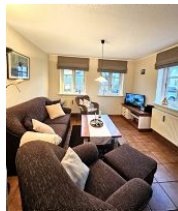
Das gemütliche Wohnzimmer.