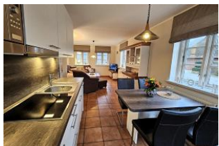
Die gut ausgestattete Küche lässt keine Wünsche offen.

Die Ferienwohnung liegt in Alkersum, einem der ältesten Dörfer Föhrs mit historischem Dorfkern mit vielen Reetdach-Häusern. Durch die zentrale Lage ist es ein guter Ausgangspunkt für die Erkundung der Insel. Die komfortable Ferienwohnung befindet sich unter Reet im Erdgeschoss und bietet Platz für bis zu 4 Personen. Die komplett eingerichtete Küche enthält ein Ceranfeld sowie einen Backofen und Geschirrspüler. Eine Terrassentür führt Sie direkt aus der Küche auf die Terrasse mit Gartenmöbeln und einem gemütlichen Strandkorb. Die Wohnung verfügt über zwei Schlafzimmer. Im ersten Schlafzimmer befindet sich ein Doppelbett. Im zweiten Schlafzimmer finden Sie zwei Einzelbetten. Ein eigener Parkplatz steht Ihnen vor dem Haus zur Verfügung.