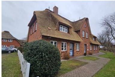
Das reetgedeckte Haus von außen. Die Ferienwohnung befindet sich im EG links.