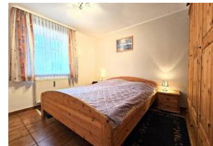
Das erste Schlafzimmer mit Doppelbett.