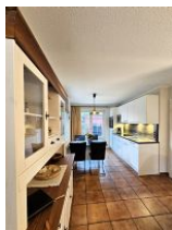
Der große, helle und lichtdurchflutete Raum mit direktem Ausgang auf die eigene Terrasse.