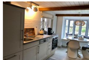
separate Küche mit Esstisch