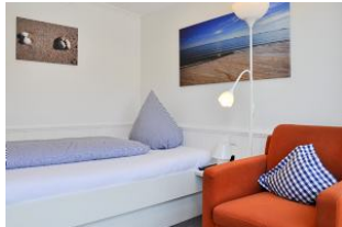
Schlafen im großen Einzelbett