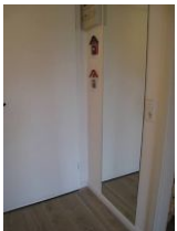
Der Eingangsbereich mit großem Spiegel.