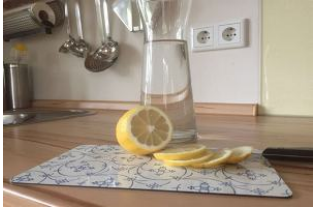
Sauer macht lustig ...