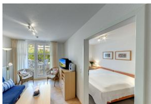
Blick in das Schlafzimmer