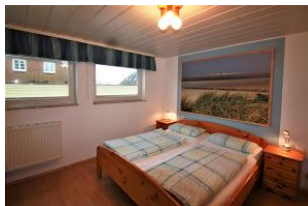
Schlafzimmer mit Doppelbett.