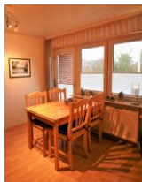
... gemütlicher Essecke bietet reichlich Platz für 4 Personen.