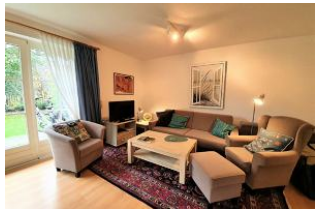
Das gemütliche Wohnzimmer.

In einer ruhigen Sackgasse liegt diese Ferienwohnung im EG eines 4-Parteienhauses. Die Unterkunft verfügt über ein sehr gemütliches und großzügiges Wohnzimmer mit einem Ausgang auf die Terrasse und in den sichtgeschützten Garten mit Strandkorb. Das Schlafzimmer ist mit einem Doppelbett ausgestattet. Die offene und moderne Küche ist voll ausgestattet und lässt keine Wünsche offen. Das Duschbad ist hell und freundlich. Die Wohnung wurde mit viel Liebe zum Detail eingerichtet und ist der ideale Ort zum Entschleunigen.