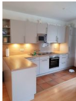
Die gut ausgestattete Küche.