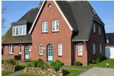
Das schöne Haus von außen.