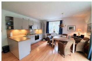
Die offene Küche mit einladendem Sitzplatz.