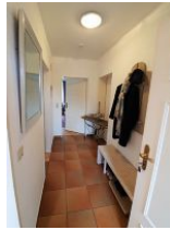
Der kleine Flur.