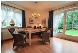
Der geräumige Essbereich.