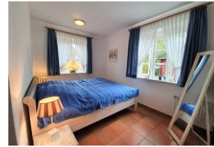
Das komfortable Schlafzimmer.