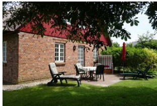
Auf der Terrasse erwartet Sie ein Strandkorb, Tisch und Stühle sowie eine Liege.