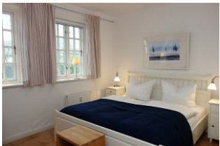
Das Elternschlafzimmer mit großem Doppelbett 180x200cm