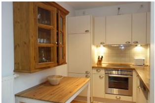
..der alte Schrank beherbergt die Gläser...