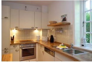
Der Blick in die Küche....