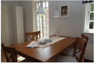
...nehmen Sie Platz, es scheint, als gäbe es gleich etwas zu essen...