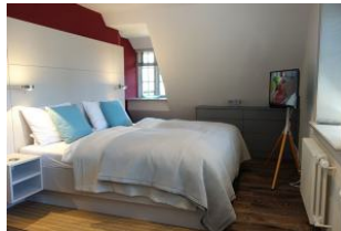
Das große Doppelbett im "roten" Schlafzimmer, TV