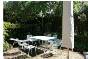
...herrlich eingewachsene Terrasse, Tisch und Stühle, 2 Liegen.