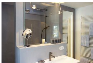
...hinter dem großen Spiegel verbirgt sich ....