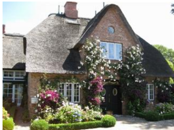
Reethus 5, ein Hausteil mit Stil.

Die Unterkunft verteilt sich über EG und 1.OG.