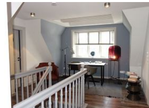
Der Flur im OG mit Schreibtisch für kreative Gedanken.