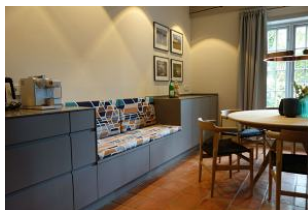
eine zusätzliche Sitzbank am Esstisch