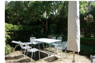
...herrlich eingewachsene Terrasse, Tisch und Stühle, 2 Liegen.