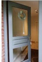
Treten Sie ein, das neu gestaltete Haus Neshörn erwartet Sie ....