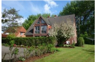
Das Haus Neshörn, Am Leuchtturm 4 in Wyk

Das Haus Neshörn ist zu erreichen über die Straße "Am Leuchtturm" Hausno. 4 liegt gemeinschaftlich mit der "Strandvilla" auf einem großen Grundstück der Familie Buchner/Petersen. Die Whg. 1 (Rungholt) befindet sich im EG mit herrlicher Süd - Terrasse. Der große Wohnraum mit offener Küchenzeile, das Schlafzimmer mit großem Doppelbett, das moderne Duschbad und nicht zuletzt die Nähe zum Strand, lassen das richtige Urlaubsfeeling aufkommen.