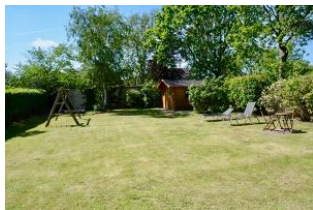
Garten mit Schaukel

Sind Sie reif für die Insel? Haben Sie lust die Seele einmal richtig baumeln zu lassen? Dann sind Sie in diesem Haus genau richtig!