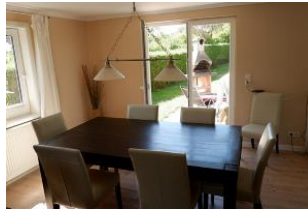
Wohnen im Haus Lindemann