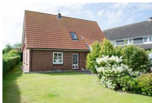
Aussenansicht vorne Hus Utersum