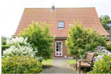
Aussenansicht, Hus Utersum

Die Unterkunft verteilt sich über EG und 1.OG.