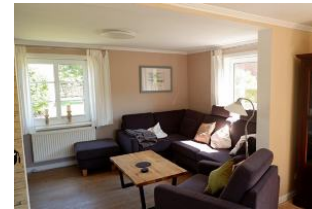
Wohnbereich im Erdgeschoss