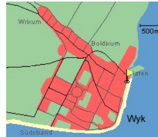
Entfernungen, zirka: zum Bäcker 25 m, zur Einkaufsmöglichkeit 25 m, zum Flugplatz 3,0 km, zum Golfplatz 3,0 km, zum Hafen 50 m, zum Meer 2 m, zum Badstrand 2 m, zum Ortszentrum 0 m