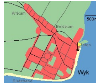
Entfernungen, zirka: zum Bäcker 25 m, zur Einkaufsmöglichkeit 25 m, zum Flugplatz 3,0 km, zum Golfplatz 3,0 km, zum Hafen 50 m, zum Meer 2 m, zum Badestrand 2 m, zum Ortszentrum 0 m