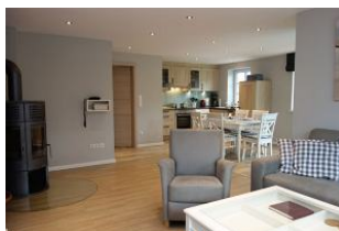
Der gemütliche Sitzbereich mit Blick zum Esstisch und zur Küche. Platz.