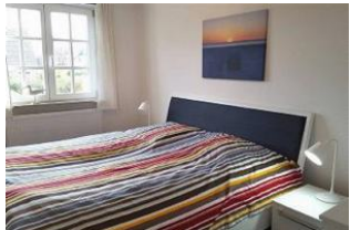
Das große Schlafzimmer im 1. OG