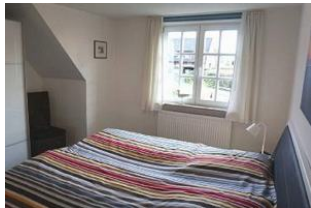
... mit gemütlichem Doppelbett ...