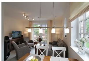
Blick in das Wohnzimmer