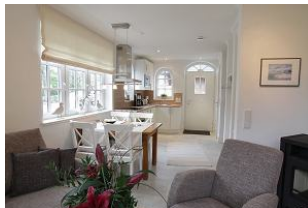
Blick in die Küche