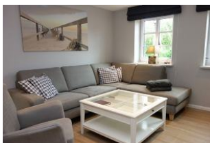
Die große Couch hat für alle ein Plätzchen