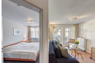
Tür zum Schlafzimmer