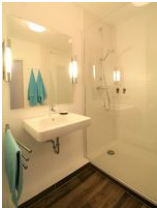
... mit großzügiger Dusche.