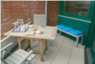
Auf dem großzügig geschnitten Balkon können Sie wunderbare Urlaubsstunden verbringen.