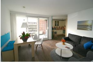
... mit direktem Ausgang auf den Balkon.