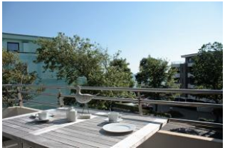
Bereits beim Frühstück auf dem Balkon können Sie den Blick auf die Nordsee genießen.