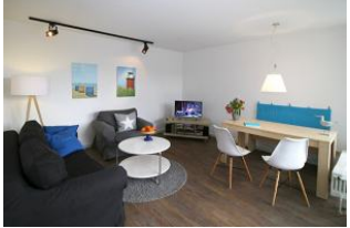
... mit Essecke und ...