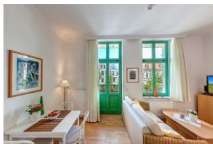
Küchenzeile und Eßplatz