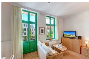
Kombinierter Wohn- / Schlafraum

STRANDNAH! Nur ca. 100 m zur Strandpromenade mit BALKON! Gemütliches 1-Zimmer-Apartment mit guter Ausstattung. Geräumiger Wohn-/Schlafraum mit Doppelbett und Sitz-/Sofaecke, Küchenzeile mit Essplatz, Duschbad, kleiner Vorflur, Balkon. Die Wohnung verfügt über einen Pkw-Stellplatz. Abstellraum für Fahrräder und ähnliches ist vorhanden. Eine Sauna in der "Villa Germania" kann kostenpflichtig genutzt werden. Vom Haus aus können Sie das Ortszentrum und die bekannte Ahlbecker Seebücke in ca. 3 bzw. 5 Minuten zu Fuß erreichen.