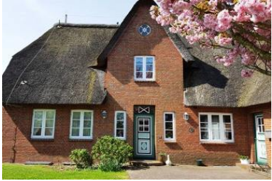
Haus Faltings in ruhiger Lage im Ortsteil Goting mit 3 Wohneinheiten