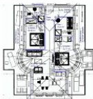
Wohnungsgrundriss (Möblierung exemplarisch)