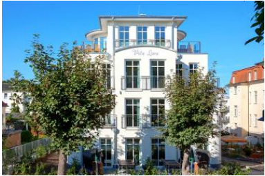
Hausansicht aus der Architektenplanung