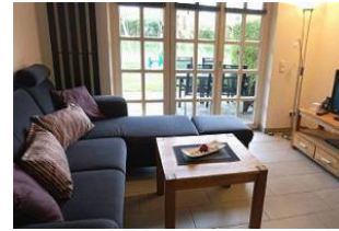
... mit direktem Ausgang auf die eigene Terrasse und in den Gemeinschaftsgarten