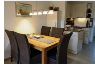
Der Essbereich für gemeinsame Stunden