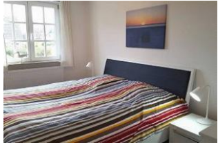
Das große Schlafzimmer im 1. OG ...