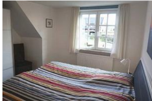
... mit gemütlichem Doppelbett ...