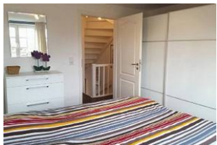
... und großem Kleiderschrank