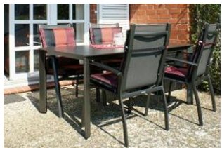
Die eigene Terrasse

Haustiere sind nach vorheriger Absprache gerne Willkommen!