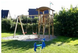
Der gemeinschaftliche Kinderspielplatz im Garten