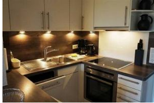
Die kleine Küche ist voll ausgestattet