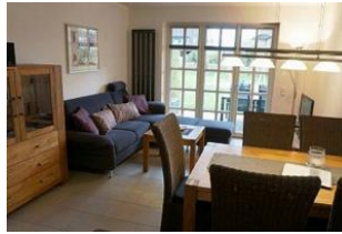
Das gemütliche Wohnzimmer ...