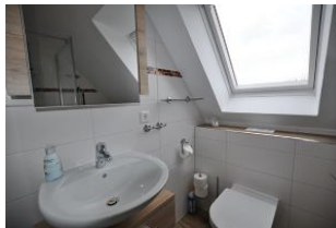
... und Tageslicht.