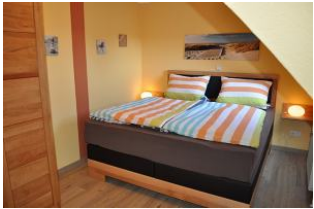
... mit Boxspringbett und Stauraum.