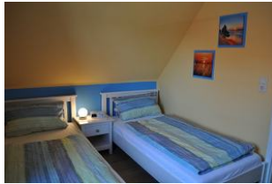
Das zweite Schlafzimmer...