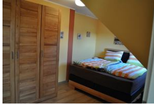
Das große Schlafzimmer...