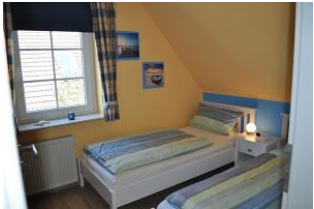
...mit zwei Einzelbetten.