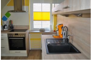
... und lässt keine Wünsche offen.