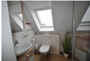
Das helle Badezimmer ...