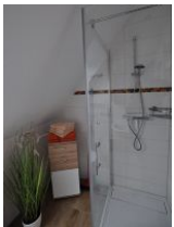
... mit großzügiger Dusche ...