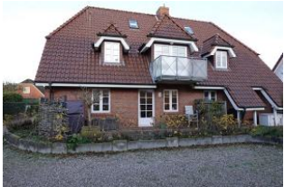
Die Terrasse im Winterschlaf