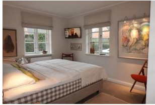
...wer mag, kann auch vom Bett aus fernsehen....