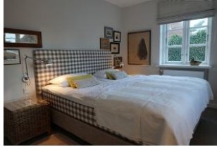
Großes Doppelbett im Schlafzimmer ohne Fußteil 180x200cm