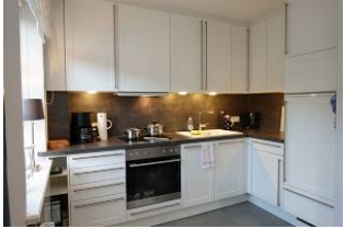
die offene Küche hat alles, was man so braucht.