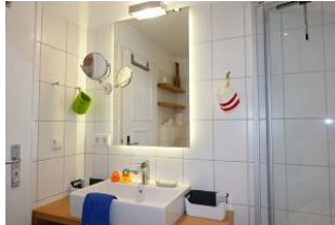
Das Badezimmer mit Handwaschbecken..