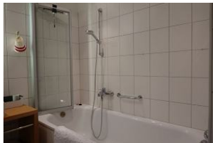
..Badewanne mit Duscmöglichkeit.