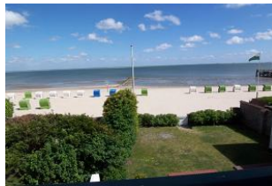
Das Foto zeigt den Blick vom Balkon des Hauses und das lädt zu jeder Jahreszeit ein. Hier können Sie einen Erholungsurlaub der kurzen Wege mit Nordseeluft pur genießen. Man spürt regelrecht die leichte Meeresbrise.....