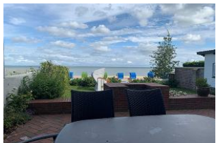
Die überdachte Terrasse ist möbliert.