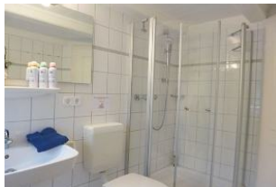
Ein zweites Duschbad mit Tageslicht steht Ihnen in der Wohnung zur Verfügung.