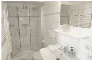
Das en suite Bad mit walk in Dusche ist hell gefliest. Dort steht ein kombiniertes Wasch/Trocknergerät zur kostenfreien Nutzung bereit.