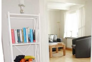
Das Ambiente der Wohnung wirkt heimelig und einladend.