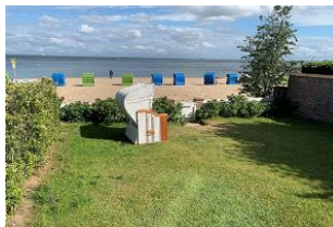
Der Garten mit überdachter Terrasse, Strandkorb (April-Oktober), Gartenmöbeln und direktem Strandzugang steht Ihnen zur alleinigen Nutzung zur Verfügung.