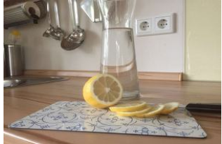
Sauer macht lustig ...