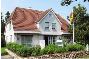
Das gemütliche Mittelhaus in Nieblum, Gartenstraße 12

Die Unterkunft verteilt sich über EG und 1.OG.