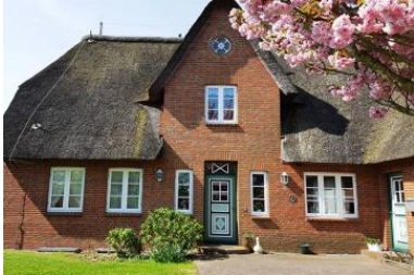
Haus Faltings in ruhiger Lage im Ortsteil Goting mit 3 Wohneinheiten